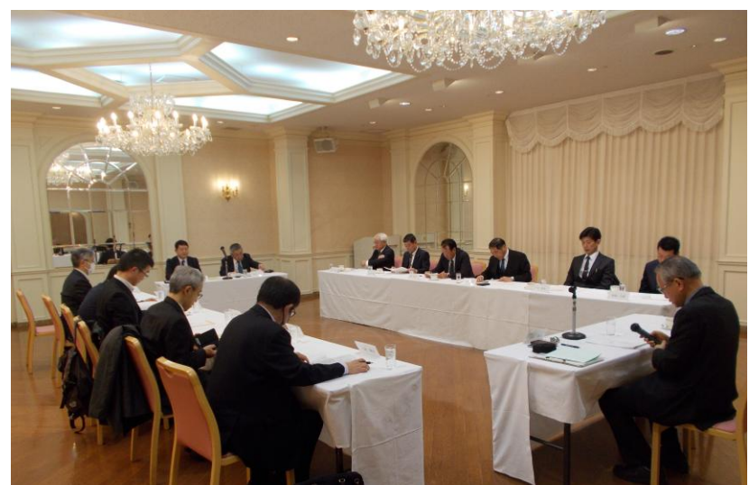
福島県生コンクリート品質管理監査会議の模様