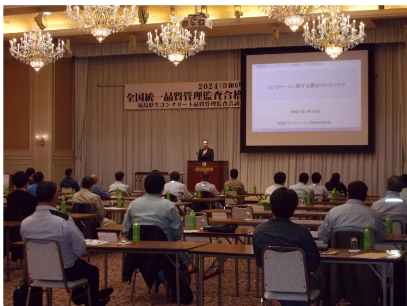
合格証交付式・講演会の模様