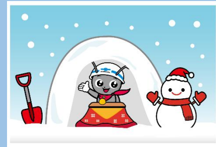
なまリンちゃん (全生連イメージキャラクター)

〒960-8035 福島市本町5-8 福島第一生命ビルディング6F TEL 024-523-1695 FAX 024-522-3685 E-mail fukusima@zennama.or.jp