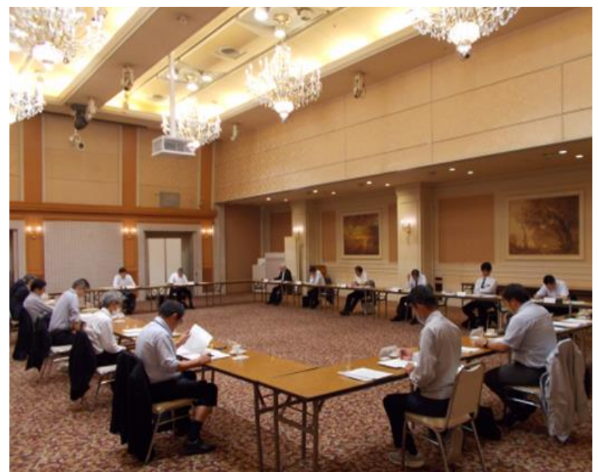
福島県生コンクリート品質管理監査会議の模様