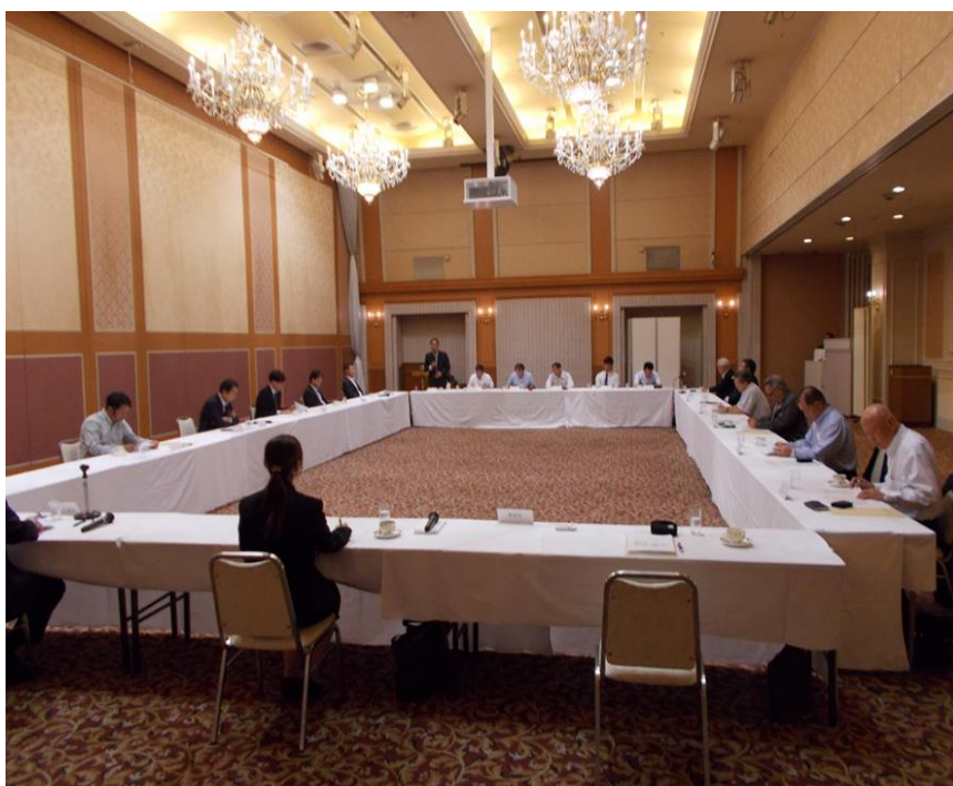
合同委員会の模様